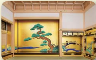
名古屋城本丸御殿 (イメージ)