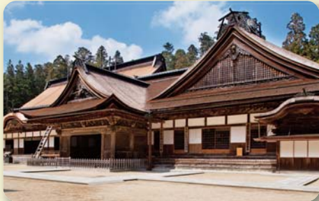
高野山金剛峰寺 (イメージ)