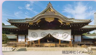
靖国神社 (イメージ)