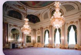
迎賓館赤坂離宮 朝日の間 (イメージ)

宮廷建築家片山東熊が設計を手がけた、日本における唯一のネオ・バ ロック様式の西洋風宮殿建築です。嘉仁親王が天皇に即位した後「東 宮御所」は「離宮」として扱われ「赤坂離宮」と改められました。